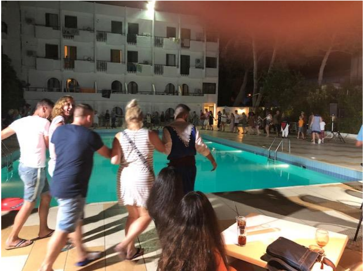
Allemaal aan de sirtaki.