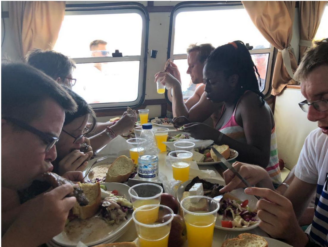
cretense wijn, brood, salade en lamsvlees.