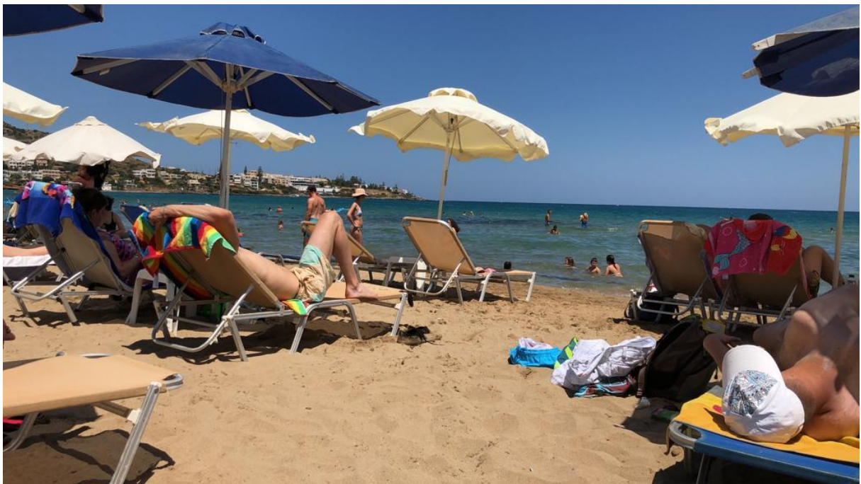
Heerlijke ligbedden en parasols