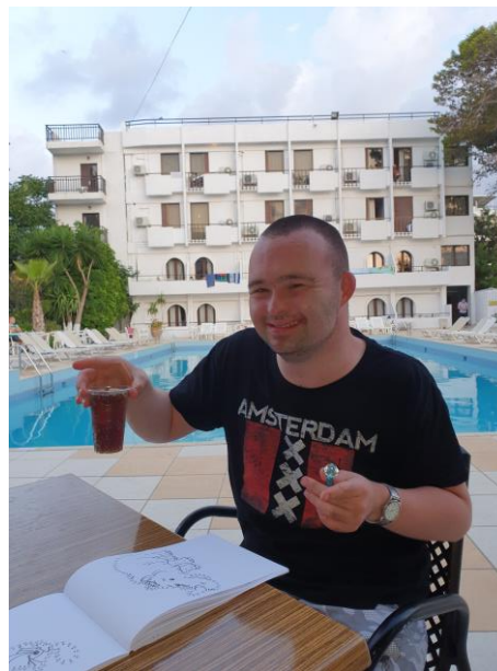
Vermaak aan het zwembad

We hebben veel contacten met andere vakantiegangers in het hotel. In de middag willen sommigen toch nog de stad in. Met kleine groepjes gaan we winkelen en wandelen langs de haven. Er worden weer mooie souvenirs gekocht.