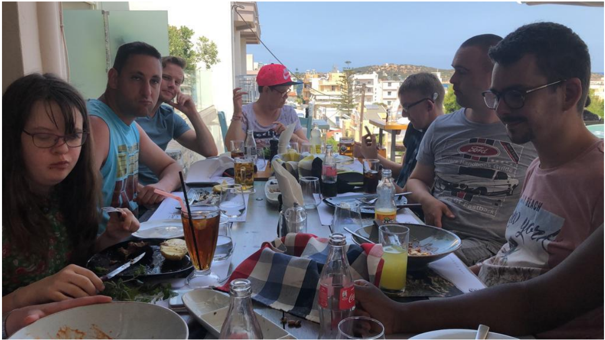
ff uitpuffen van de warmte

Na nog een ronde door de stad was het tijd voor de bus terug.