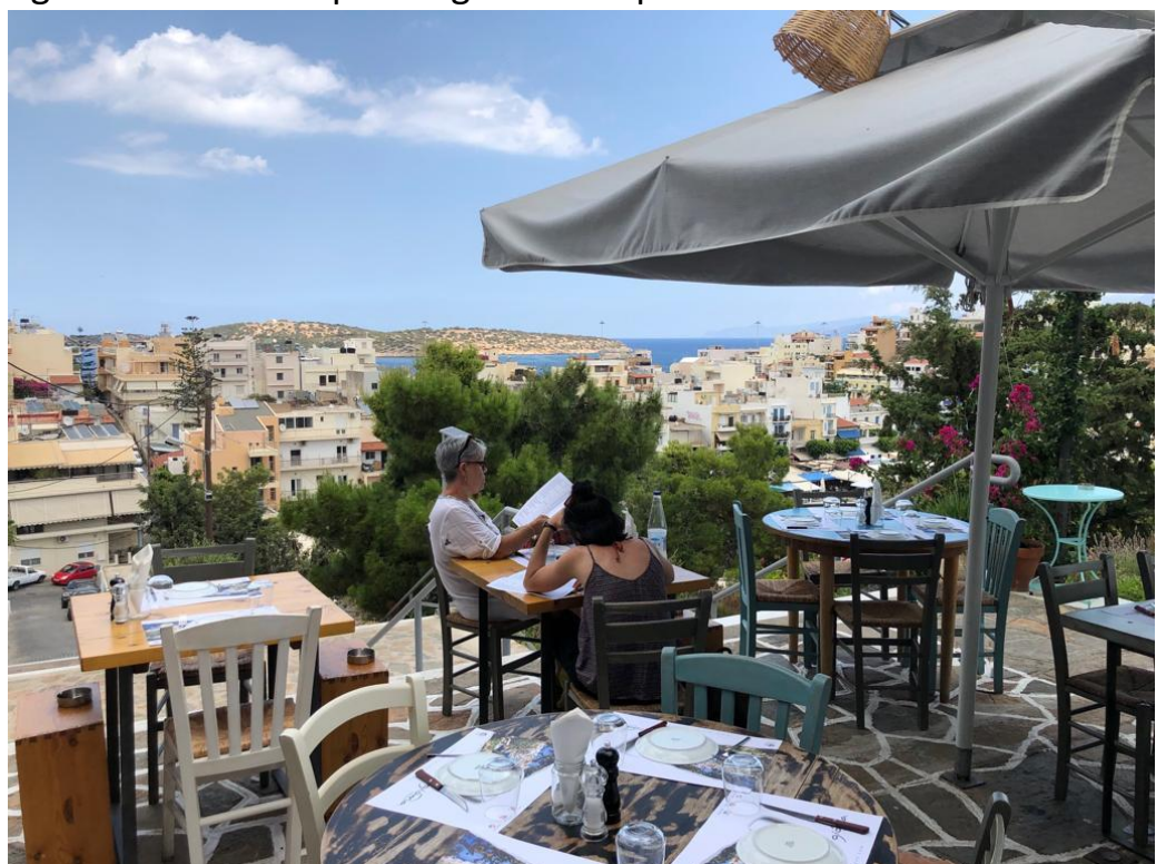
Uitzicht op de stad.

We zijn begonnen met een koffie op een van deze terrassen. Daarna ging het los in de winkelstraten. We gingen naar huis met T-shirts, tassen, telefoongeluidsboxen en wat toeristische spullen. Dit was pas de eerste fase..... Het werd tijd voor een lunch. Iedereen kon van de kaart echte Griekse specialiteiten bestellen. En zo hadden we allemaal iets anders voor onze neus, heerlijk! We konden genieten van een prachtig uitzicht op het binnenmeer.