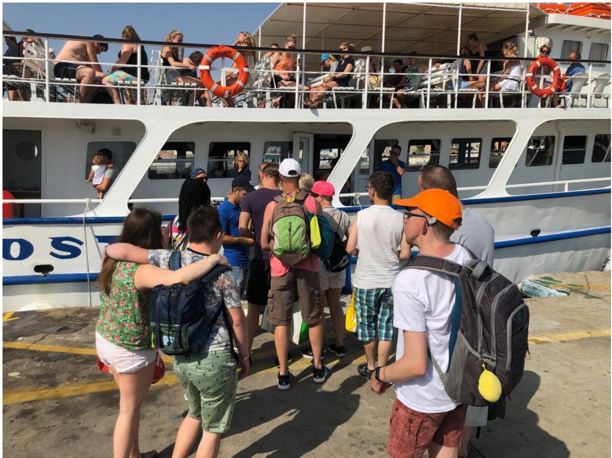
De boot naar Spinalonga.