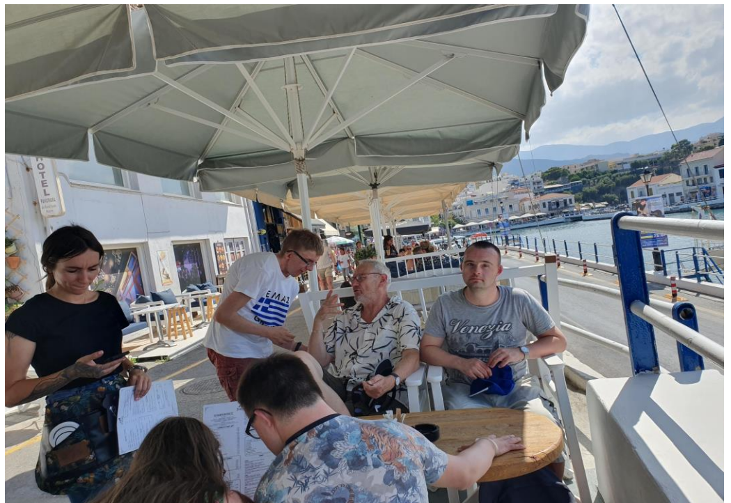
Prettige plek voor overleg.

De meeste stemmen gaan voor een "rustdag". Dit betekent zonnen, zwemmen en wie wil de stad in.