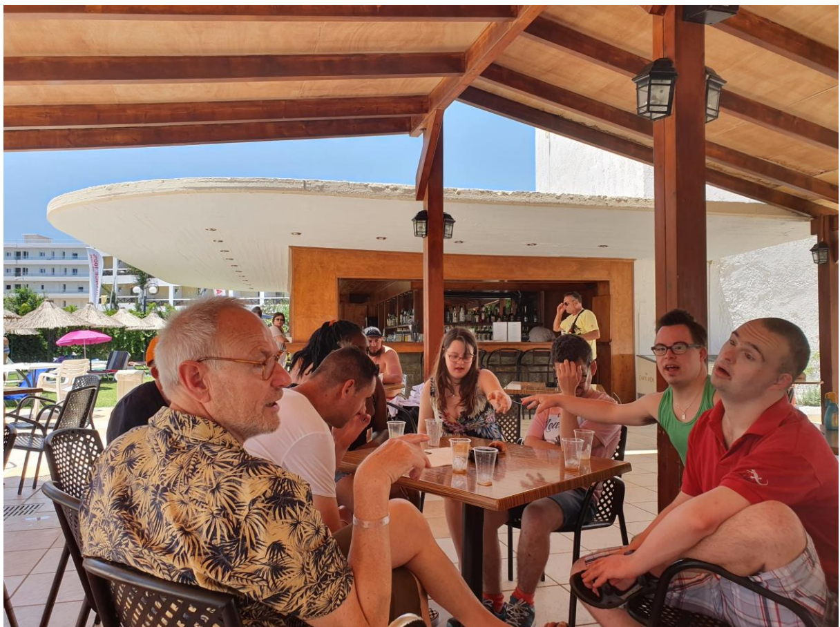
Onze grote vriend de poolbar.

's Avonds, na het diner werd het tijd om de winkelstraat van Chersonissos te bezoeken. Alle winkels zijn tot laat open, dus alle tijd om inkopen te doen. Ansichtkaarten, T-shirts, petjes en toeristische prullaria werden ingepakt. Toch lokken de cocktails weer en die worden tot 11 uur geschonken. Dus op naar de poolbar voordat we te laat zijn.