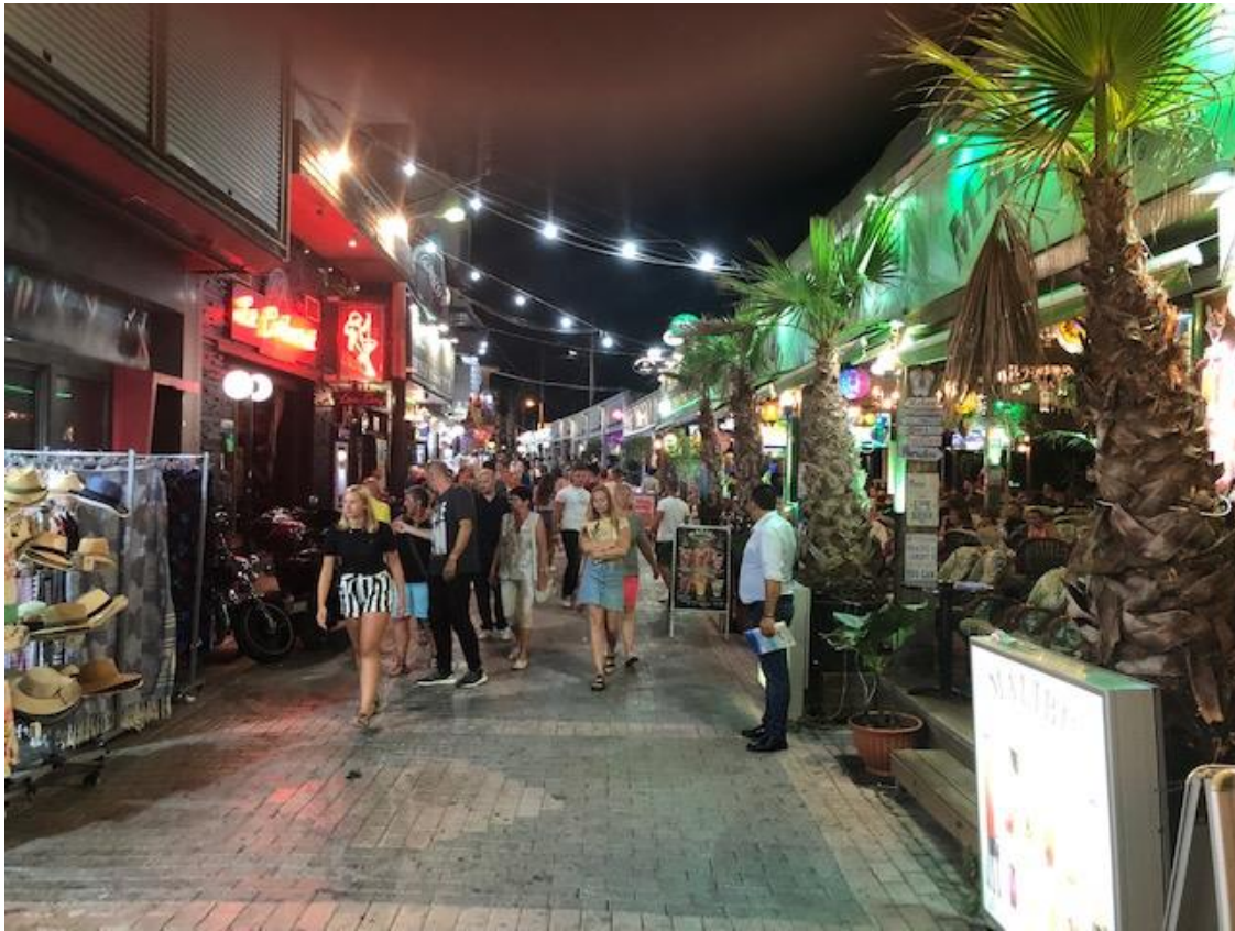
Winkelen, winkelen, winkelen 's avonds.

We eindigen de dag bij de poolbar met wat kaartspelletjes en gezellig praten. We bespreken wat we de volgende dag gaan doen.